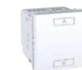
Комбиниран модул за управление на щори