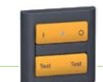
Комплект за тест