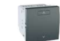
Комбиниран модул за управление на осветлението