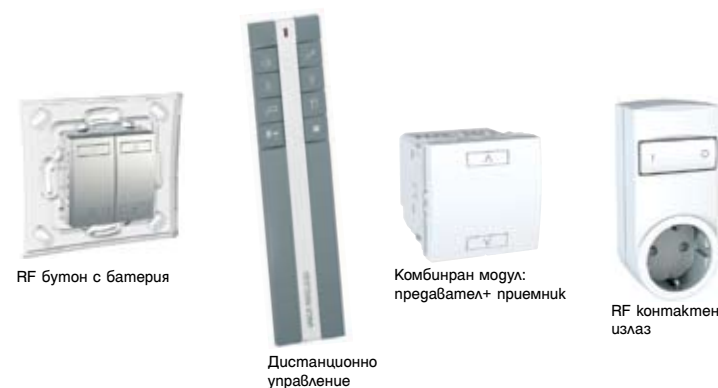
RF бутон с батерия