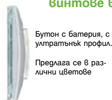
Бутон с батерия, с ултратънък профил. Предлага се в различни цветове