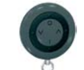
Дистанционно управление тип "ключодържател"