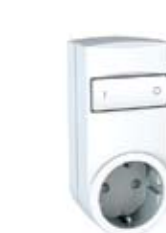
Подвижен контактен излиз – реле или димер