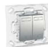
Бутон, с възможност за избор между една двумодулна или две едномодулни калачки в различни цветове