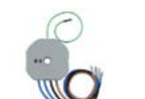
RF приемник микромодул